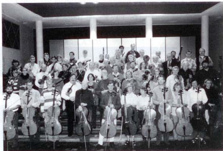
Nach der Probe eine Aufstellung für den Fotografen: Die Hannoverische Orchestervereinigung